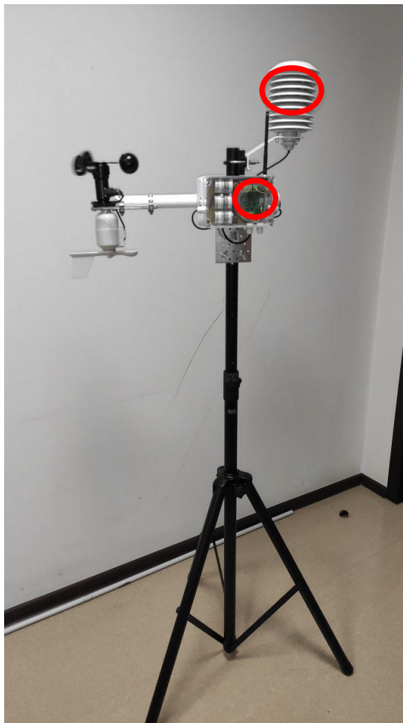
Рис. 1 Расположение светодиодных индикаторов

1.1.7. Станция рассчитана на работу в течение 2 лет при замере качества воздуха и передаче данных каждые 20 минут.