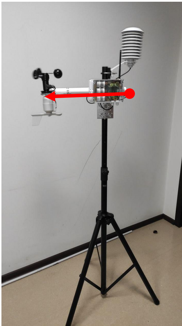
Рис. 2 Ориентация станции

2.1.3. Для корректного определения направления ветра СМЭМ устанавливается по направлению на север. Для этого разместите станцию так, чтобы воображаемая линия, проведенная от блока управления к анемометру, указывала на север.