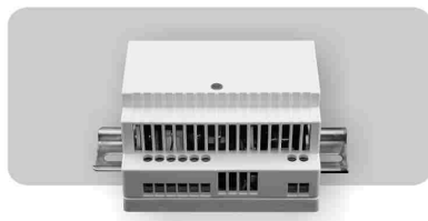
модель: ST-DIN 12/5UPS

ИСТОЧНИК ПИТАНИЯ СТАБИЛИЗИРОВАННЫЙ, ПРЕОБРАЗОВАТЕЛЬ СТАТИЧЕСКИЙ